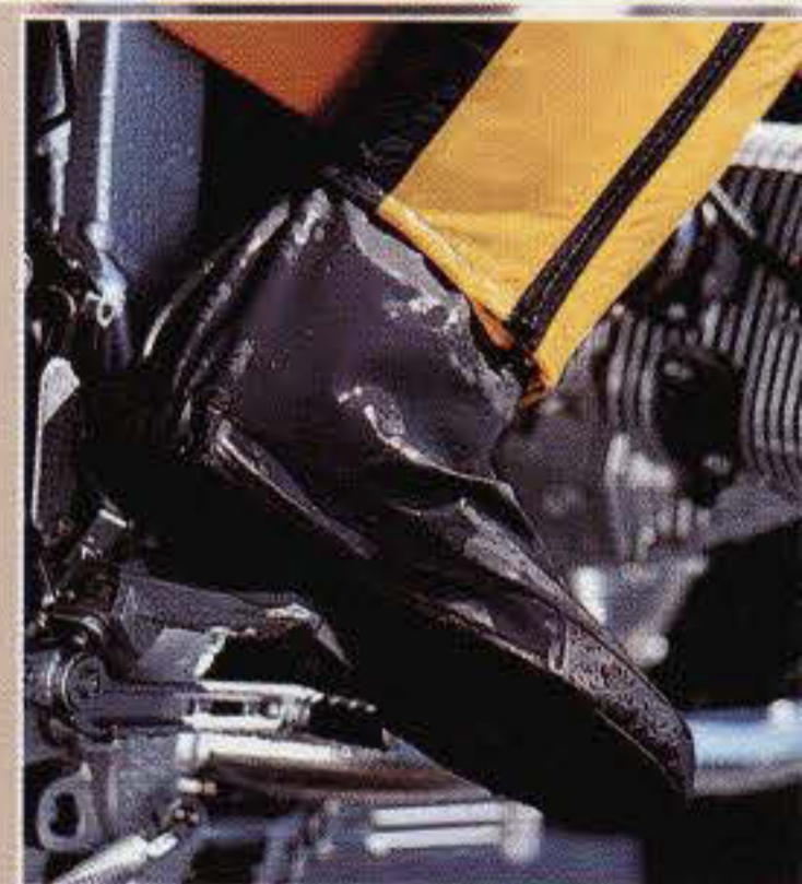
Bild 1: Die zum Anzug RainTech passenden Gamaschen sind mit Druckknöpfen an die Hosenbeine anknüpfbar. So bietet Ihnen der Anzug Regenschutz von Kopf bis Fuß.